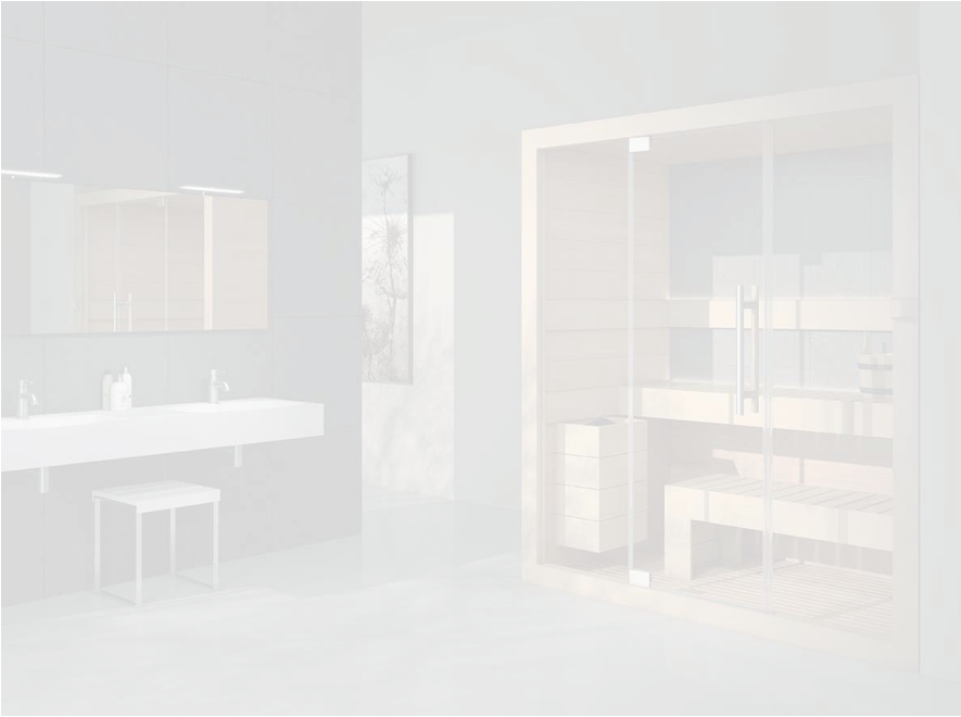
Sauna Bio Level by Kinedo

La Sauna Bio Level di Kinedo permette un duplice utilizzo: sauna tradizionale finlandese oppure Bio Sauna . La modalità Bio Sauna è caratterizzata da un calore meno intenso e un maggiore tasso di umidità che consente di prolungare la permanenza in sauna. La Sauna Bio Level è disponibile in sei dimensioni standard, ma Kinedo offre anche soluzioni su misura che consentono di creare un progetto personalizzato.