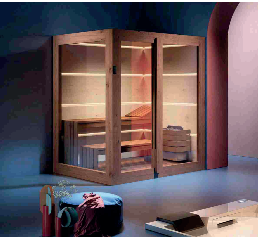
Aura by Treesse, Design Marc Sadler

La Sauna Bio Level di Kinedo permette un duplice utilizzo: sauna tradizionale finlandese oppure Bio Sauna . La modalità Bio Sauna è caratterizzata da un calore meno intenso e un maggiore tasso di umidità che consente di prolungare la permanenza in sauna. La Sauna Bio Level è disponibile in sei dimensioni standard, ma Kinedo offre anche soluzioni su misura che consentono di creare un progetto personalizzato.